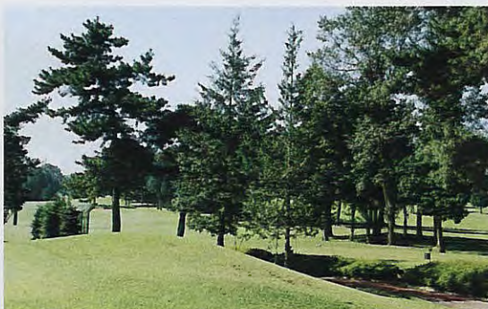
サワラを植樹した北8番

このホールは、ともすればグリーンをねらった“ソレダマ”が、隣りのティーグラウンドに飛びこむ危険があった。サワラはヒノキに属する常緑樹で、成長すると姿・形のよい高木となるそうで、これで周辺の景観もよくなり、危険防止の役目も兼ねそなえることとなった。