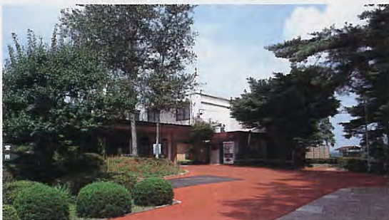
化粧直しされたマスター室周辺