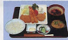
海老、ロース、ヒレカツ膳 1,500円