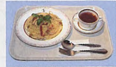
きのこスパゲッティ 1,000円

近年、健康重視のためかプレーヤーの食事に対する傾向も変わってきた。限られたメニューの中で、手ごろな価格設定と幅ひろい年齢層を考えながら、いかに対応すべきか腐心のあとが伺える。