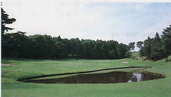
排水工事を終えた黄金4番の池周辺