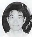
セニア選手権優勝者

今回、お世話になりました倶楽部関係者、並びに役員の皆様方、どうもありがとうございました。