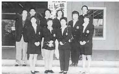
惜しくも連続入賞を逸した女子選手と関係者の皆さん