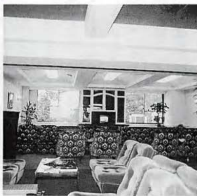
このほど拡張された男女兼用談話室

タイム、プレー後のおくつろぎのひとときが、いっそう快適なものになると存じます。どうぞご利用下さい。