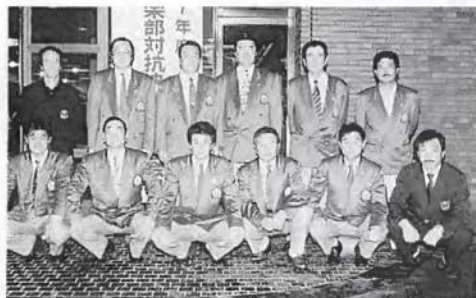
15位と健闘した男子選手団