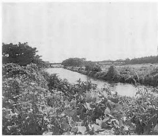
現在も面影が偲ばれる伝説発祥地

歩いたが、河童は主膳の前にはすがたをあらわさないばかりか、そのあとをねらうように、川辺の馬をおそっていた。