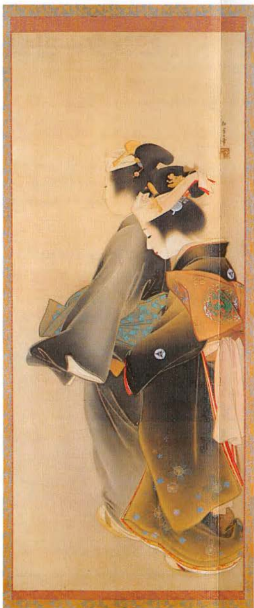
上村松園 「花嫁の図」 絹本彩色

歴史上の人物から当世風俗の女性まで描いた近代美人画の巨匠・上村松園。美人画とはいっても、江戸の浮世絵師のそれと随分違っており、また同じ近代美人画の鍋木清方や伊東深水のものとも違う。画家本人が女性であるということ、それゆえに彼女の心情が女性達の表情を通して伝わってくる、いわば一種の自画像として見る事ができる美人画なのである。