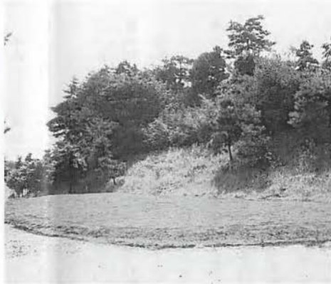
完成し、使用開始を待つばかりの黄金コースの練習グリーン

なお、使用開始時期ですが、芝の発育状態をみて、来年の梅雨明けを予定しております。今しばらくの間、お待ち下さい。