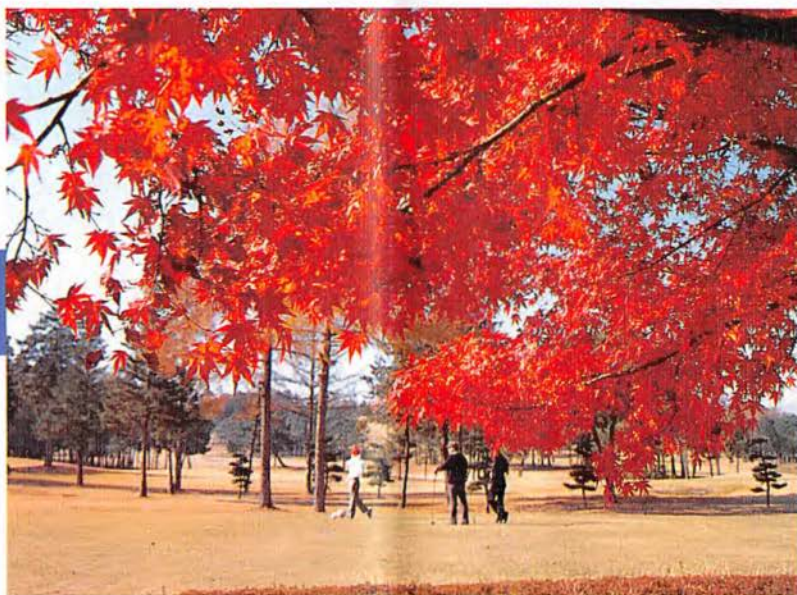
北コース、7番ミドルホール