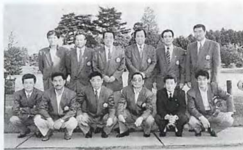
4年ぶりに決勝進出を果たした男子チーム