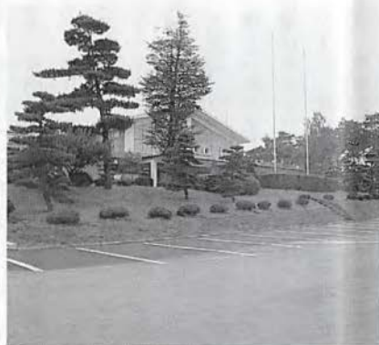
新設されたハウス前の駐車場

また、平日でも公式競技やオープン競技の行われる日は、同様の状態になりますので、できるだけ相互にお乗り合わせいただき、ご来場下さいますよう、ご協力の程、お願い申し上げます。