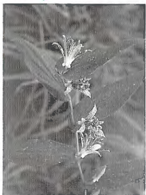
ヤマジノホトトギス

「ナイス・バーディ!!」 「ナイス・イーグル!!」 初心者ゴルフファアの私が、コースに出る前夜に必ず夢みる言葉です。明日こそは一個でいいからバーディを決めたい。そんな気持ちで夢にまで出てくるのでしよう。スタート前の練習グリーンで思い出してはひとり微笑んでいると、「きょうは調子よさそうだね」などと仲間にひやかされる始末。 それにしても、ゴルフ用語には鳥に係わる言葉が多い。鳥の持つ自在性に憧れるのかも知れません。空を自由に飛んで目的地に確実に着地できるその能力を、自分の打ち出すボールに与えたい。そんな気分でしょうか。