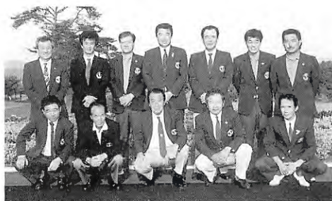
4位にとどまった鹿沼チーム