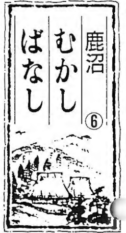
〈小杉義雄著「鹿沼のむかし話」より「栃の葉書房刊」〉