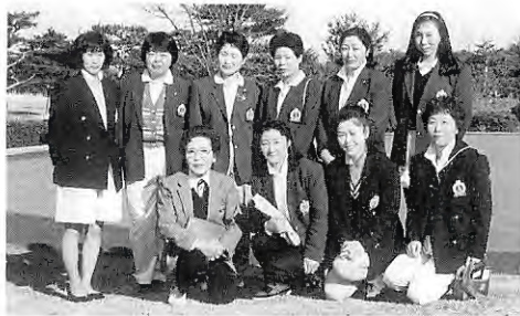
3年連続の入賞を果たした鹿沼女子チーム