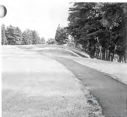
カート路の新設、延長舗装工事が完了した南13番ホール