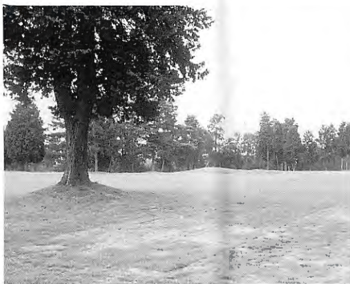
フェアウェイの芝張替えが行われた北3番ホール