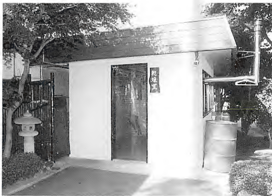
このほどマスター室南側に完成した乾燥室

これまでは降雨時などに、乾燥室がなく大変ご不便をおかけしておりましたが、これからはハーフタイムの待ち時間内に、濡れた雨具やグロブ、タオル等を乾かし、降雨時も気分良くスタートして下さい。