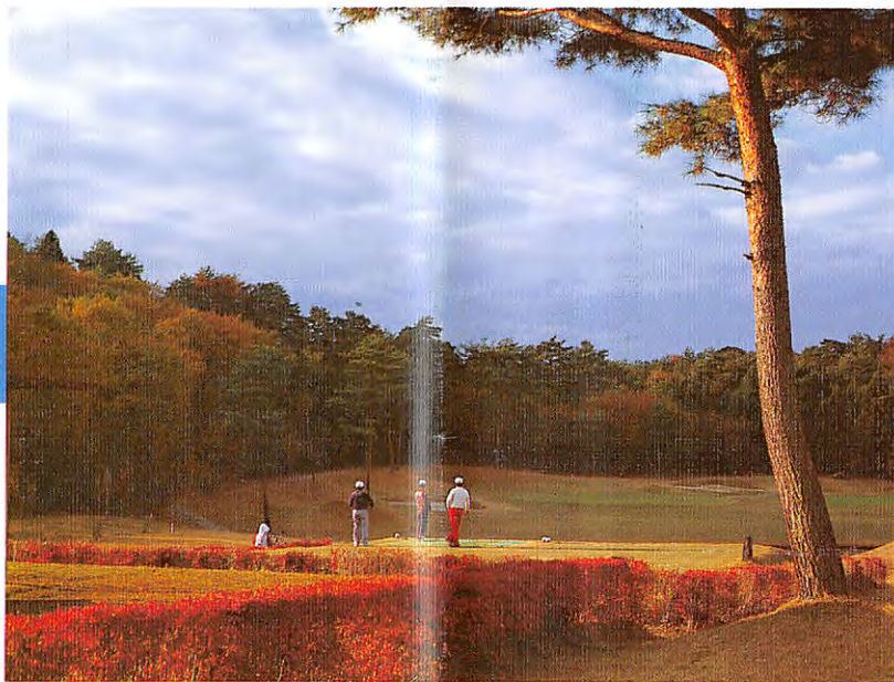
黄金コース、4番ショートホール