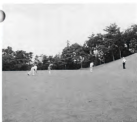
アプローチ部分の芝張替えが行なわれた、黄金 8 番ミドルホール

・ 13番ミドルホール ・ 14番ロングホール ・ 18番ミドルホール || レディースティーの部分張替えを実施 ||