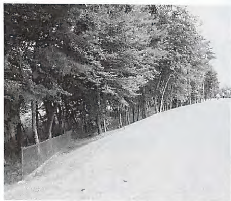
防球ネットが新設された、南14番ロングホール