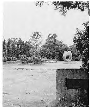
現在は公園として残されている、稚児沼跡地

作って食べると、かならず、お乳がでるようになる。と、話してください。これは宇都宮明神のお力によるもので、助けていただいたわたしのお礼です。」