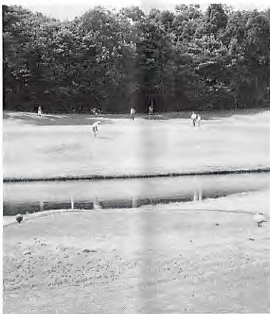
芝張替えが完成した北 6 番バックティー(左)と黄金 4 番レディスティー(右)