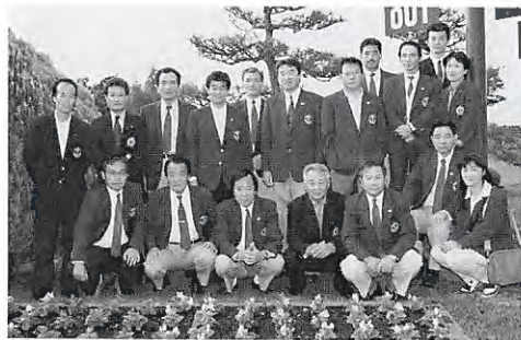
悔しくも、決勝進出を選した鹿沼選手団