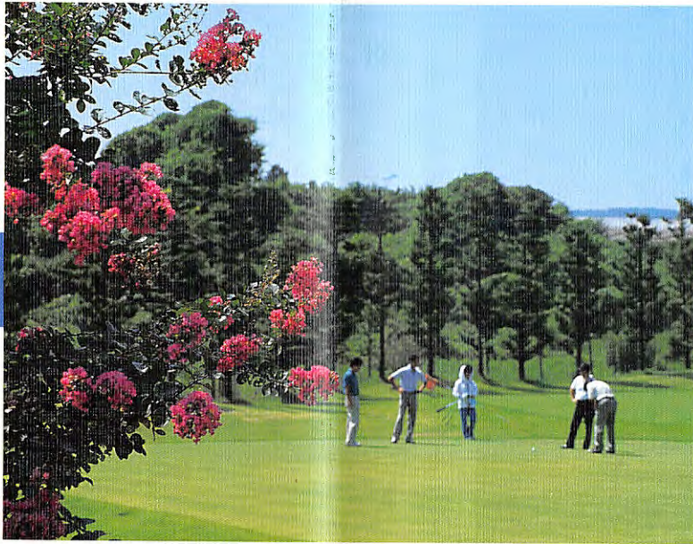
北コース、16番ミドルホール