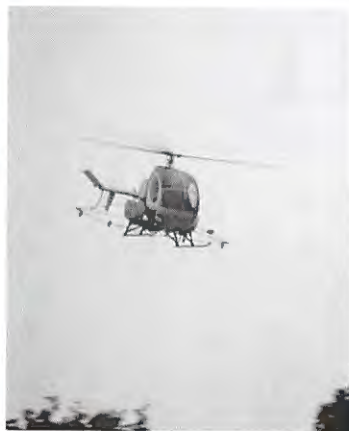
空中散布の実施風景

今後も当倶楽部におきましては、春、秋の農薬使用量の多い時期を選定し、水質検査を実施していくとともに、4名の「ゴルフ場農薬適正使用士」を中心に常に指導要綱に沿った農薬使用を行い、プレーヤーはもとより、地域住民の方々にも安心していただける万全の維持管理を行っていく所存です。