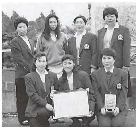
3位入賞と大健闘した鹿沼チーム