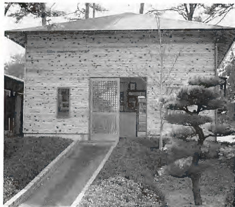
新築された北6番コース売店

工事中は、プレーヤーの皆様には何かとご迷惑をおかけいたしました。悪しからずご容赦下さい。