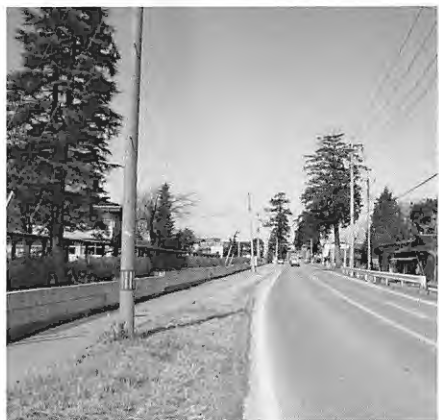
伝説の発祥地となった南押原地区(写真は磯町)

と、へんじをしておばさまの家にいった髯さまは、びつくりしたつてよ。いままで食べたこともないごちそうがたくさんでたんだつて。髯さんは、だされたものを、