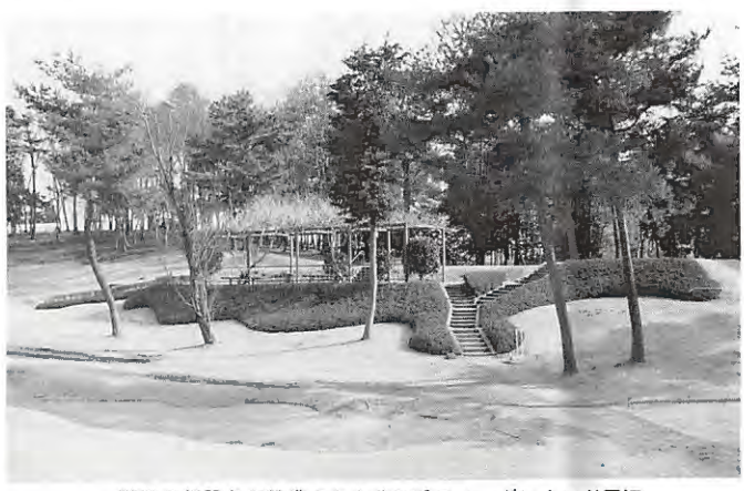
階段の新設など整備された北13番ティーグラウンド周辺