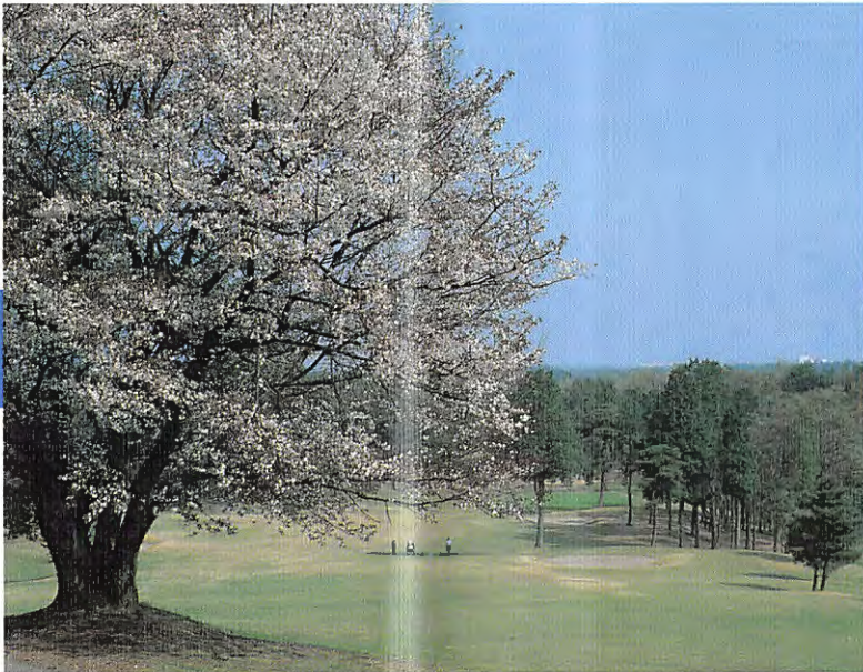
南コース、1番ミドルホール